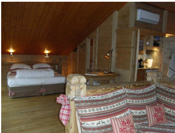
rest, dat alles bekleed met authentiek hout...